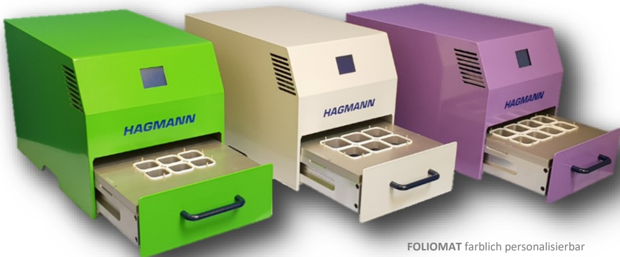
FOLIOMAT farblich personalisierbar