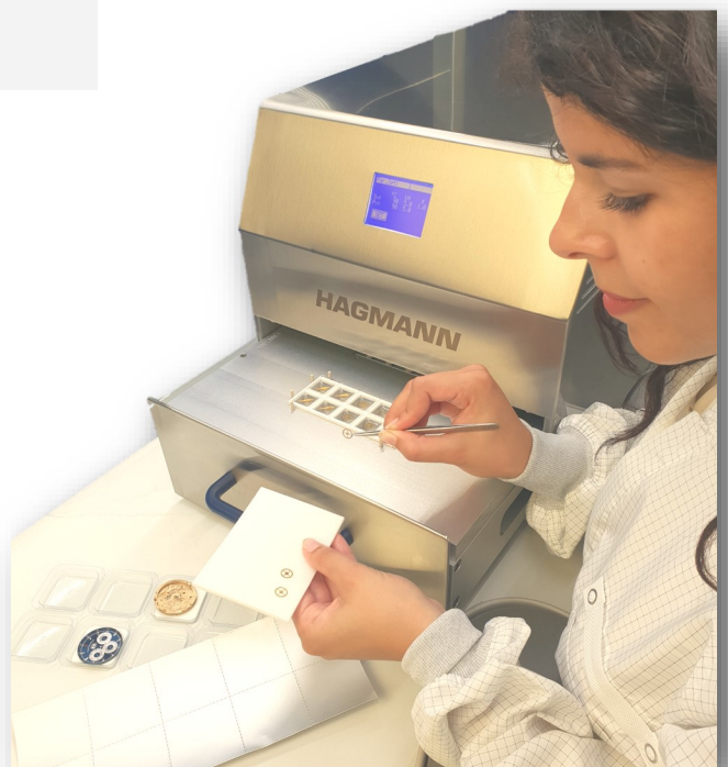
FOLIOMAT klassisch in INOX