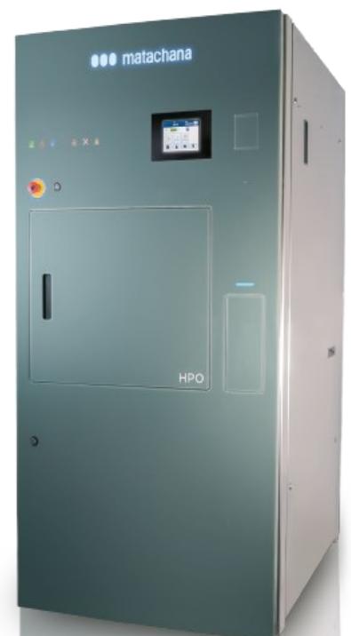
H 2 O 2 Plasma Niedertemperatur-Sterilisator

INNOVATION FLEXIBILITÄT BEDIENERFREUNDLICH EFFIZIENZ TECHNOLOGIE KONNEKTIVITÄT SICHERHEIT NACHHALTIGKEIT