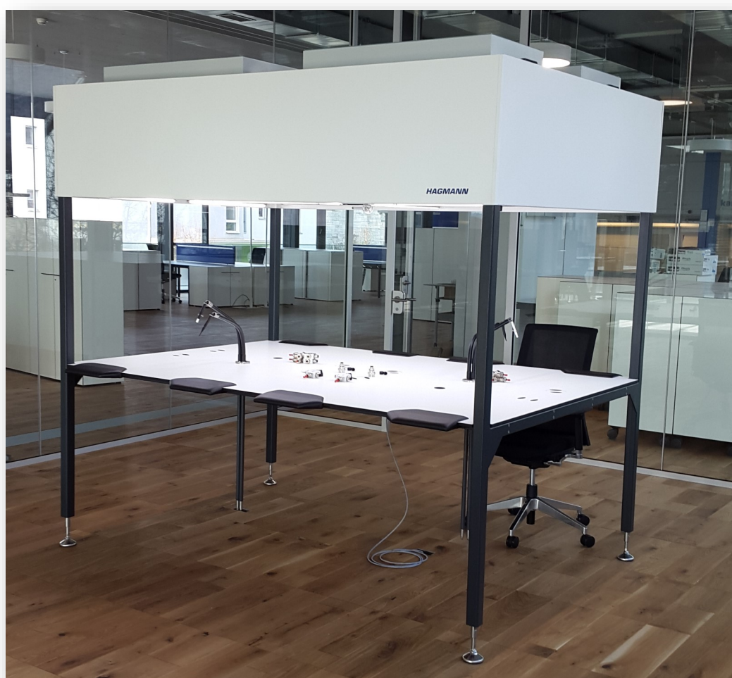
HAG-SSLF: Self Supporting Flux Laminaire avec plateau de table intégré