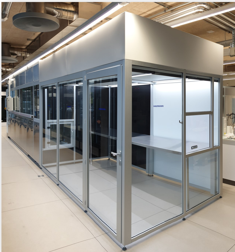
HAG-ECLF: Easy Cell Flux Laminaire