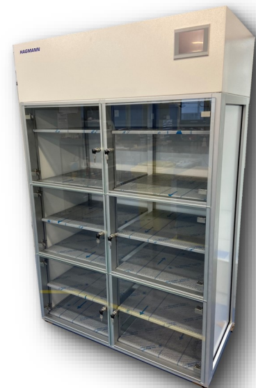
Armoire de stockage à flux laminaire: protection permanente contre les poussières et les particules