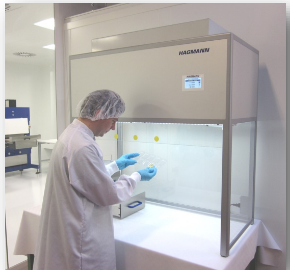
HAG-TTLF: Table Top Flux Laminaire avec machine à scellage intégrée comme système d'emballage compact à haute protection