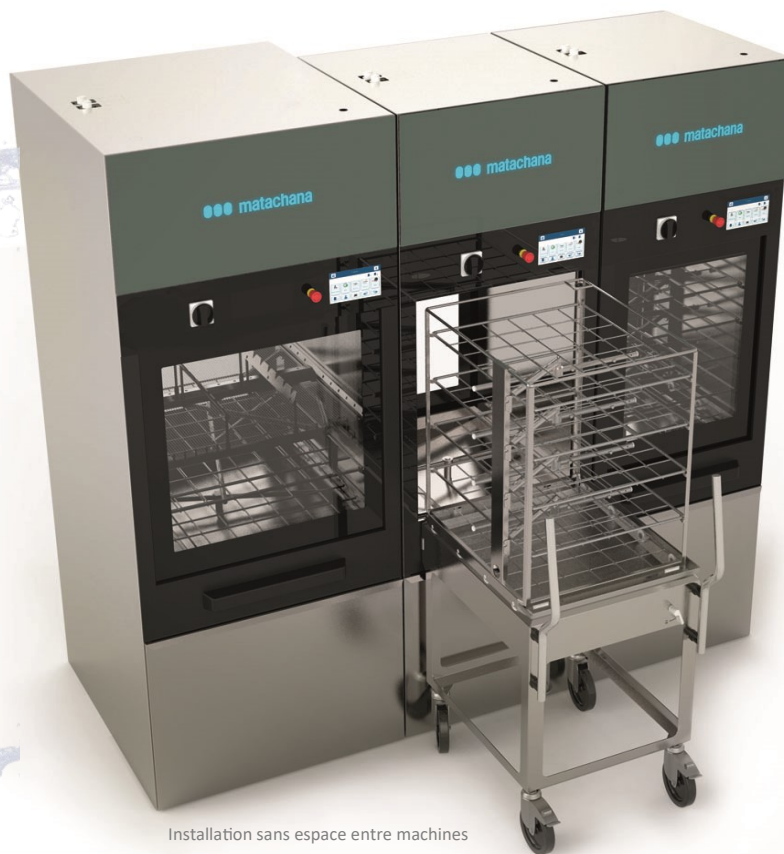
Installation sans espace entre machines

INNOVATION FLÉXIBILITÉ COMMODITÉ EFFICIENCE TECHNOLOGIE CONNECTIVITÉ SÉCURITÉ DURABILITÉ