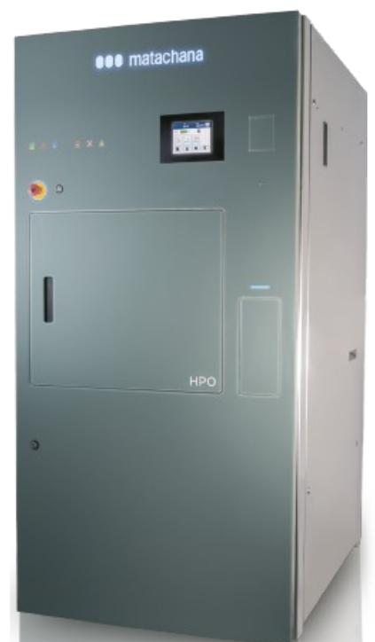
Stérilisateur à basse température par peroxyde d'hydrogène et plasma

INNOVATION FLÉXIBILITÉ COMMODITÉ EFFICIENCE TECHNOLOGIE CONNECTIVITÉ SÉCURITÉ DURABILITÉ