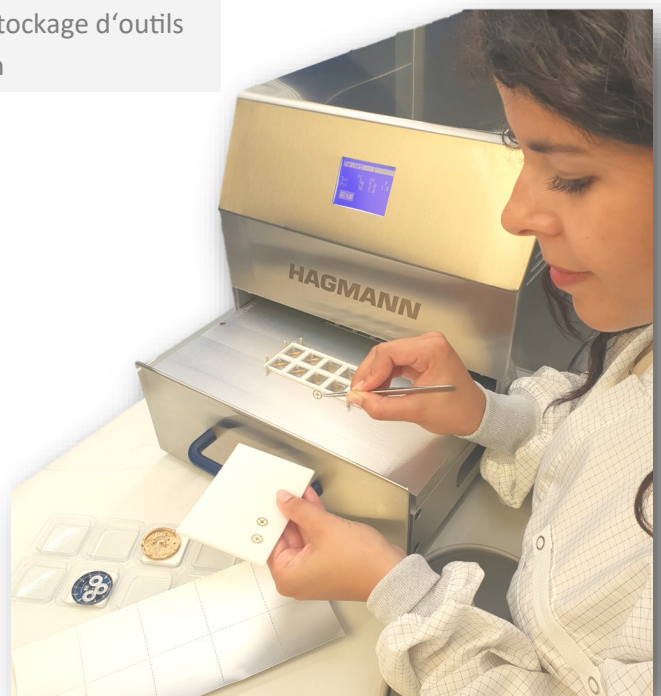
FOLIOMAT classique en INOX