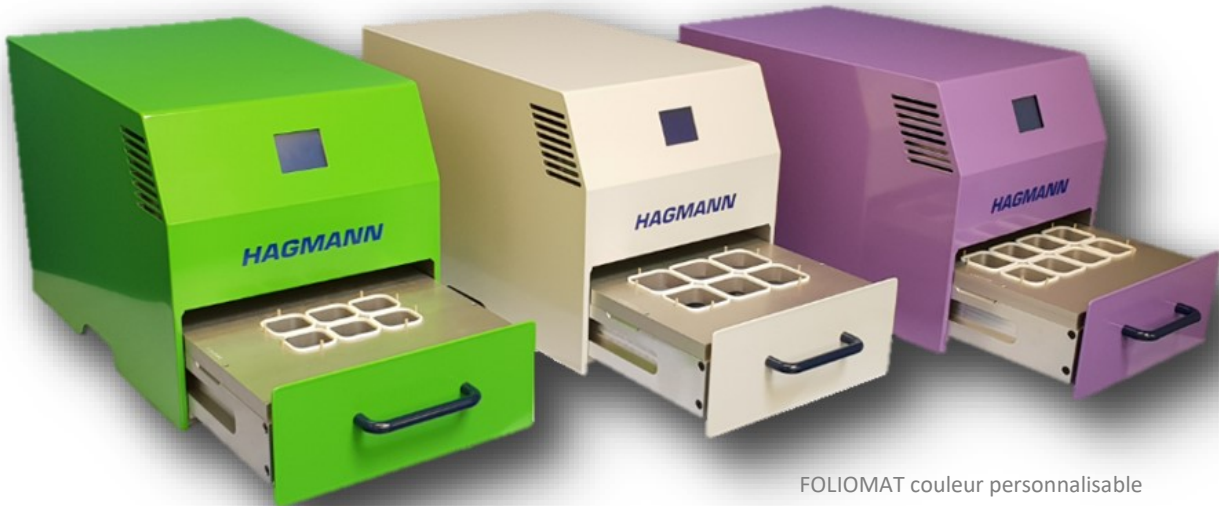
FOLIOMAT couleur personnalisable